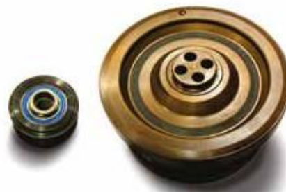
КОМПЛЕКТ ШКИВА NEW DAMPER + ШКИВ ГЕНЕРАТОРА + ИНСТРУКЦИИ

КОМПЛЕКТЫ В разработку процесса было также решено включить генератор переменного тока, как компонент вторичной системы управления с наибольшим моментом инерции. Чтобы освободить систему приводных механизмов от неравномерности вращения вала двигателя, для каждой требуемой установки шкива вала двигателя разработан соответствующий шкив свободного вращения генератора переменного тока, который входит в комплект силовой передачи вращения приводной системы и в то же время гарантирует отсутствие шума и вибрации. Комплекты поставляются с указаниями к применению, где приведены инструкции по монтажу и подробно описываются модели, к которым они применяются.